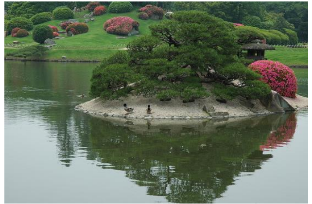
Hình 4 Một đảo nhỏ giữa hồ đại diện cho đảo Bồng Lai (vườn Koraku-en, Tokyo)

Một thành phần thường thấy khác trong bố cục mặt bằng vườn Nhật là những hòn đảo nhỏ ở giữa hồ. Các đảo này mô phỏng cho những phúc địa của tiên nhân. Theo truyền thuyết Đạo giáo, ngoài Đông Hải có 5 hòn đảo tiên là Đại Dư, Viên Kiều, Phương Hồ, Doanh Châu và Bồng Lai. Đây là nơi ở của các vị tiên nhân, được đặt trên lưng 15 con rùa khổng lồ, về sau các hòn đảo này được đồng hóa là nơi ở của Bát Tiên, tám vị thần tiên nổi tiếng trong truyền thống Đạo giáo Trung Hoa (Hình 4).