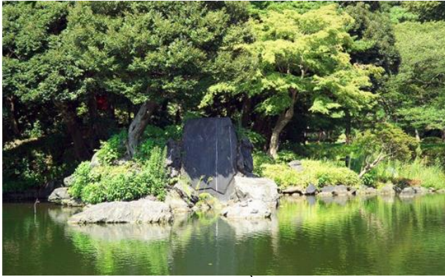
Hình 6 Đá tảng lớn đại diện đầu rùa (vườn Koraku-en, Tokyo).

chim hạc, lí do là vì đây là loài sinh vật mà các vị tiên nhân thường dùng làm vật cưỡi. Cây cối được trồng trong vườn Nhật Bản là cây tùng, cây thông, cây bách, những loại cây sống lâu năm trên đỉnh núi cao, hút khí hạo nhiên của vũ trụ, tượng trưng cho tính thoát tục, thanh cao của bậc thánh nhân ẩn cư, (Hình 6).