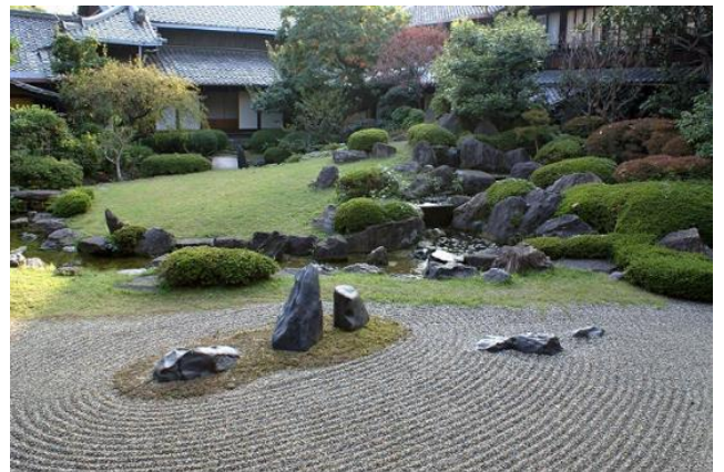
Hình 5 Tổ hợp đá cát đại diện đảo núi giữa biển (vườn Shitenno-ji, Osaka)

Trong vườn Thiền (Karesansui), hay vườn khô, các tảng đá với hình dáng kì lạ đại diện cho những đỉnh núi hay những hòn đảo, cát và sỏi trắng vừa là đại dương, vừa là biểu tượng cho mây mù. Cát được cào theo luống, theo vòng tròn đồng tâm tùy theo mục đích diễn đạt nước, hoặc mây khói. Tất cả đều thể hiện những khung cảnh lí tưởng của Đạo giáo như núi cao, biển xa,... Đá và cát (đại diện cho nước) còn là biểu tượng Âm Dương của 2 cặp đối lập. Tính biểu tượng này chúng ta thấy xuất hiện xuyên suốt trong tạo hình cảnh quan vườn Nhật [5], (Hình 5).