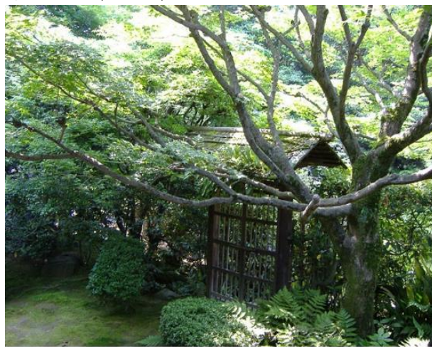
Hình 1 Cổng vào mộc mạc của vườn trà Kenshun-en, Tokyo.

người tham dự phải cúi người khi bước vào, như một ngụ ý về sự nhỏ nhoi, khiêm tốn của mình trước tạo hóa. Hình ảnh này gợi nhớ đến các túp lều tranh của các ẩn sĩ, đạo gia trên các ngọn núi cao, phiêu du cách biệt với đời (Hình 1).