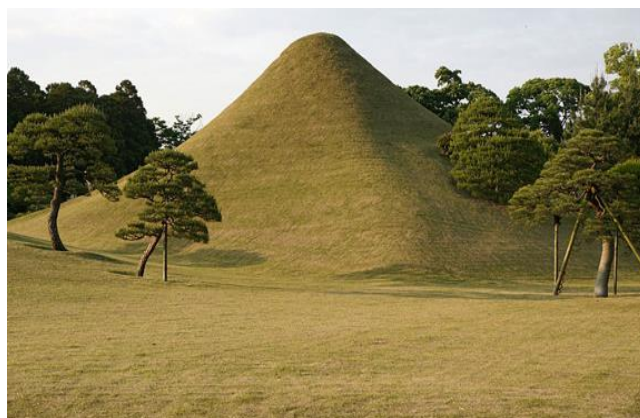
Hình 2 Ngọn đồi là bản sao thu nhỏ của núi Fuji, Vườn Suizen-ji Joju-en (1636)

Trái với vườn trà, vườn đi dạo (Kaiyu-shiki) có quy mô rộng lớn hơn, thường đến hàng mấy héc-ta. Tuy nhiên, công trình kiến trúc lại có khối tích nhỏ mang tính điểm xuyên, là một thành phần trong tổng thể cảnh quan sân vườn, rất khác với hoa viên Trung Quốc khi mà các dạng lầu các cung điện luôn đóng vai trò chủ thể trung tâm với khí thế chế ngự thiên nhiên. Người thưởng lãm ở vườn đi dạo chỉ có thể thưởng thức hết vẻ đẹp cảnh quan khi đi bộ bên trong khu vườn. Mục đích khu vườn thường là mô phỏng, thể hiện lại các cảnh đẹp trong tự nhiên hoặc trong huyền thoại của văn hóa Trung Hoa hoặc Nhật Bản (Hình 2).